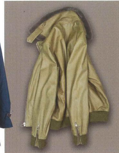
Bombers-Perfecto en en cerf lisse, col ragondin gris et doublure fourrure de ragondin ton sur ton