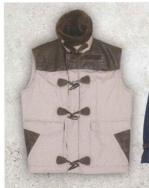
Gilet Respect en nylon Kimono, empiècements et brandebourgs en crocodile porosus, col en fourrure de ragondin.

De sublimes peaux, un savoir-faire exceptionnel et beaucoup d'audace, tel est le cocktail de Séraphin. En exclusivité pour Monsieur , son fondateur, Henri Zaks, dévoile les pièces phares de l'hiver.