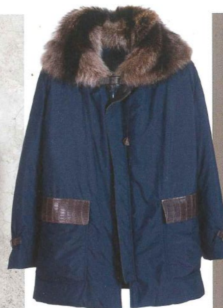
Parka Ski en nylon Kimono, empiècements crocodile, fourrure de marmotte et d'écureuil.