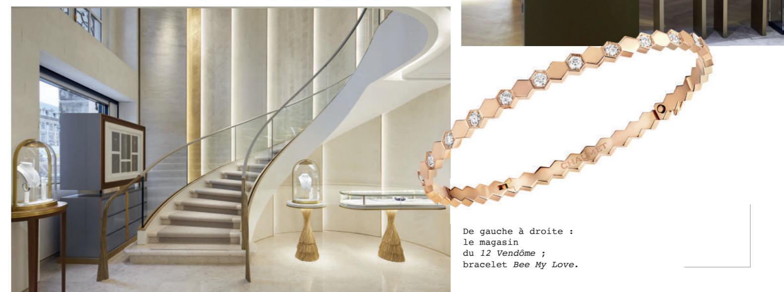
De gauche à droite : le magasin du 12 Vendôme ; bracelet Bee My Love .

Salon des Diadèmes rend hommage à cette création signature de Chaumet grâce à des murs recouverts de maquettes de diadèmes en maillechort – un alliage de cuivre, de zinc et de nickel – qui témoignent de créations joaillières exceptionnelles. Dans cet écrin pensé comme un appartement parisien où les salons en enfilade se succèdent, Chaumet dévoile ses archives aux côtés des collections contemporaines et des pièces historiques. Ici, tout fait sens et rien n'est laissé au hasard : culture, virtuosité, patrimoine et modernité sont rassemblés sous un même toit, représentant la quintessence de la Maison Chaumet.