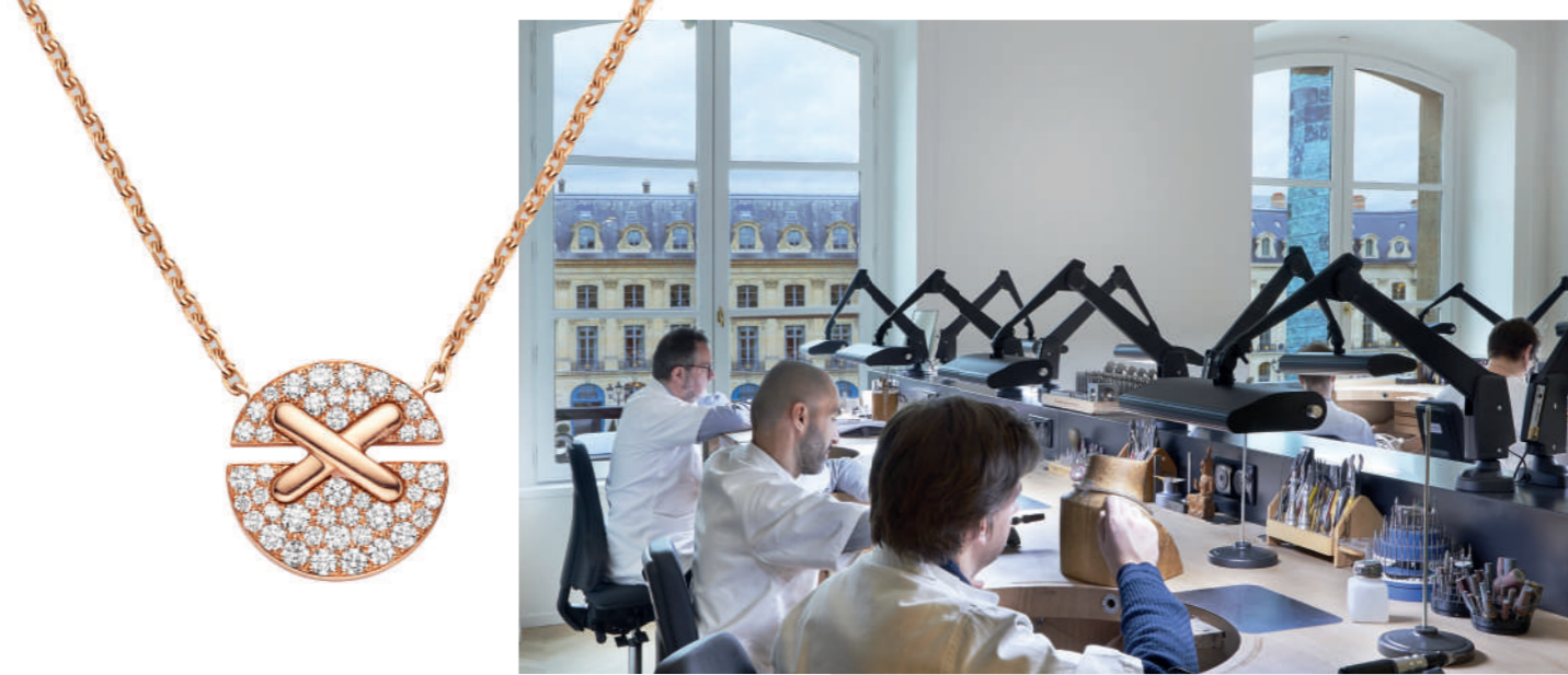
De gauche à droite et de bas en haut : Médaille Jeux de Liens Harmony ; l'atelier de Haute Joaillerie du 12 Vendôme ; solitaire Joséphine Aigrette ; collier et bague Skyline , collection Perspectives de Chaumet ; le Salon des Diadèmes.