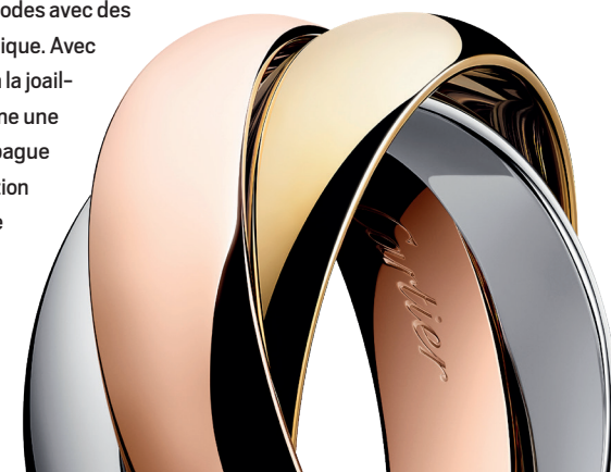
BAGUE TRINITY DE CARTIER CLASSIQUE Or gris, or jaune, or rose

Alors qu'elle se décline en bracelets, pendentifs, colliers et boucles d'oreilles, la bague Trinity de Cartier est sans cesse en évolution. Elle s'illustre dans une version joaillière pavée de diamants ou de pierres de couleur mais aussi là où on ne l'attend pas, se jouant des codes avec des matériaux inattendus tels que la céramique. Avec ses trois anneaux, Cartier ouvre la voie à la joaillerie moderne où le bijou se porte comme une seconde peau. Véritable talisman, la bague Trinity de Cartier se transmet de génération en génération sans perdre de sa magie ni de son aura qui font d'elle une star à la mesure de ses illustres muses.