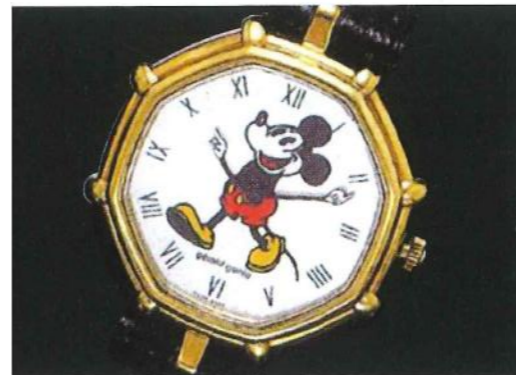
Pied de nez au sérieux horloger, Gerald Genta signe un contrat de licence avec Disney.