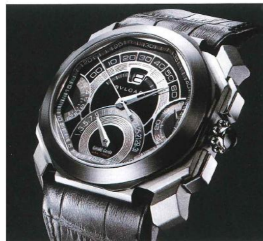
Les montres Gerald Genta sont maintenant vendues sous le label Bulgari mais le style perdure.